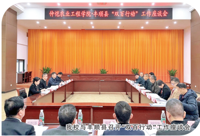
我校与丰顺县召开“双百行动”工作座谈会

成效表示肯定,同时也对后续的工作提出几点要求:一是汇聚各方力量,协同推进产业发展。充分发挥乡村振兴规划高校联盟等三大联盟的协同作用,将优质资源引入丰顺,结合当地产业基础,推动产业高质量发展。二是对标考核要求,落实主体责任。针对省教育厅对高校的考核要求,以及省“百千万工程”指挥部对丰顺的考核要求,以共建项目为抓手,围绕典型镇村的产业发展需求,动态调整项目清单,明确学校职能部门、二级学院和科研团队的主体责任,共同推进共建项目加快实施,落地见效。三是注重产教融合,培养农业人才。学校要充分发挥学科优势,将新的品种、新的技术引入企业,在帮助企业解决难题、推动农业“三产”融合发展的过程中培养懂农业、爱农业的实践型人才,更好为当地产业服务。